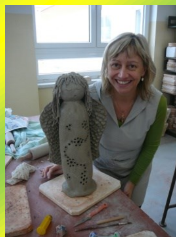
Paní učitelky na keramickém kurzu v Horní Bříže se svými výtvary